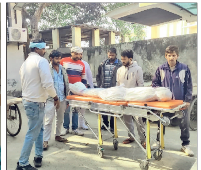
रोहतक। सपना का शव ले जाते परिजन।