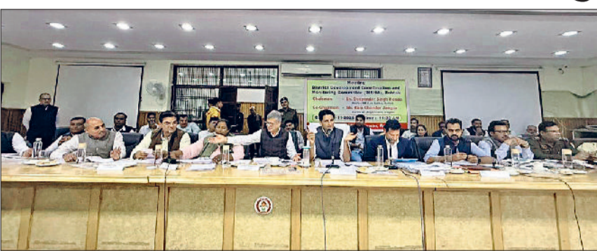
रोहतक। जिला विकास समन्वय एवं निगरानी समिति की बैठक लेते सांसद दीपेंद्र हुड्डा।